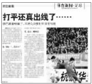
长江商报:打平还真出线了……不容易。