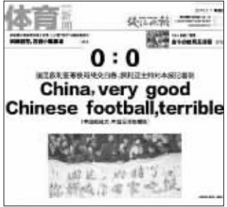
钱江晚报:中国很强大,中国足球很糟糕。