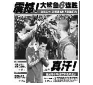
东方体育日报:真汗!说的是国足。