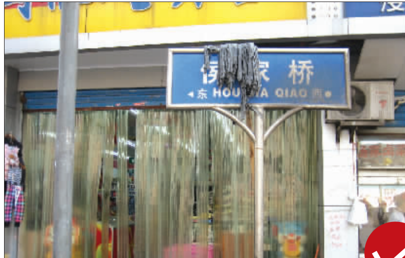
这个侯家桥路牌倒是写对了,可惜,被一只拖把遮住了。