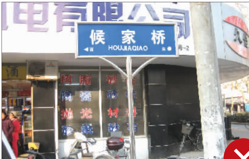
这条路应该叫侯家桥,路牌上却写着候家桥,有关部门你能细心点吗?路牌是无声的向导啊。