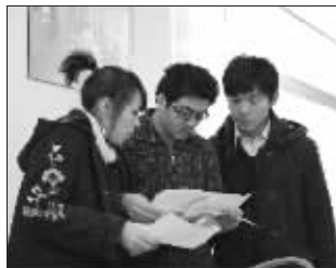
网友自拍《很差房》剧照