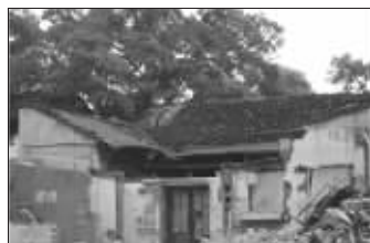
钓鱼台 192 号河房现状