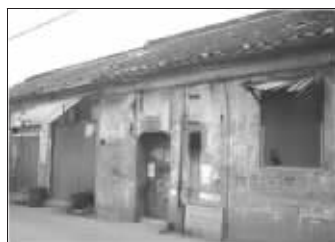
钓鱼台 196 号河房现状