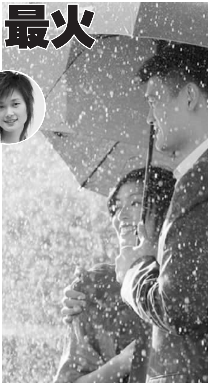
姚明叶莉夫妻恩爱