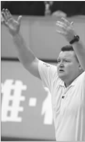
杰森的命运不由自己掌握