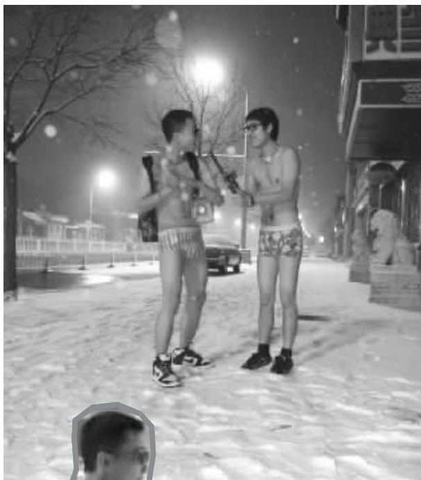
手拿话筒做出采访的模样,笑脸十足引来网友追捧