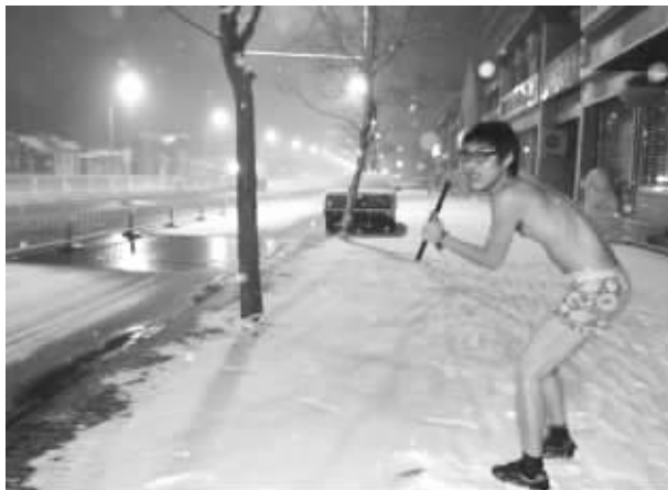
大冷天在雪地里摆出造型还真需要一点勇气

有创意才有新意,但有新意必须有心意。这两件事情告诉我们,想把网民当傻瓜,一般都不大可能。