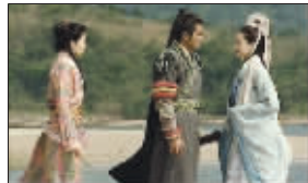
《寻秦记》中项少龙的服装