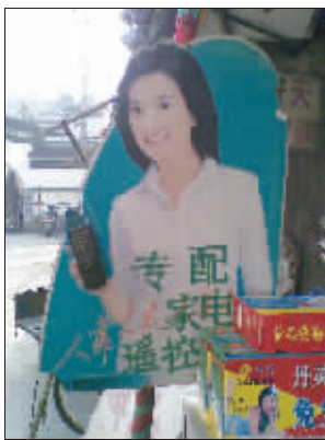
赵薇“代言” 高淳老街这家电器修理店好牛,请来赵薇做“代言”——看,赵薇手拿万能遥控器,还真像那么回事。 (作者将获得30元话费)