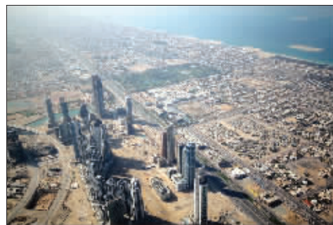
从迪拜塔上俯瞰周边建筑