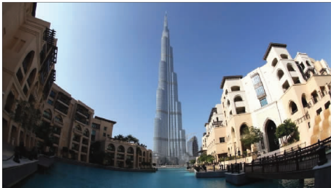
迪拜塔周边景色迷人