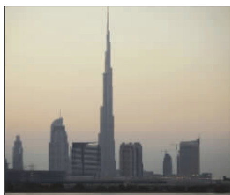
高耸入云的迪拜塔