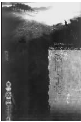
颜栋 著 江苏文艺出版社友情推荐