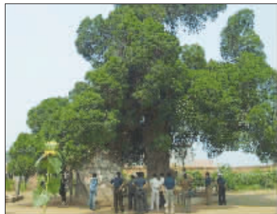
这是漳河边上最老的一棵柏树,相传曾做过曹操的拴马桩 资料图片