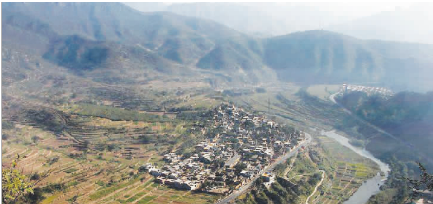
漳河两岸风光,据说曹操的七十二疑冢就在此处