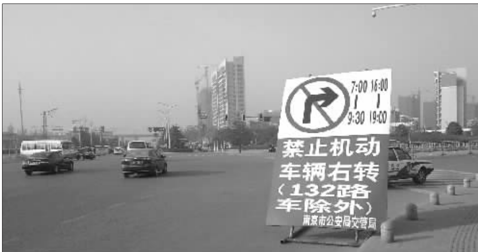
昨天,桥北逗号广场开始交通管制,以提高大桥通行效率。

“我值勤大桥这么多年,除了大年初一之外,还真没像今天这样通畅过。”九大队的民警非常欣慰。