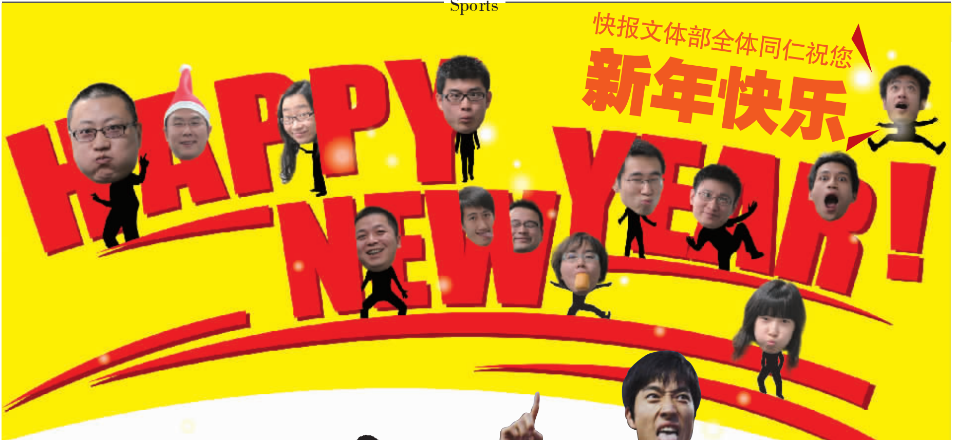
制图 沈明