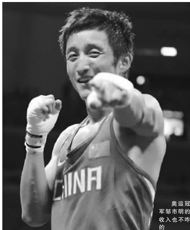
奥运冠军邹市明的收入也不咋的