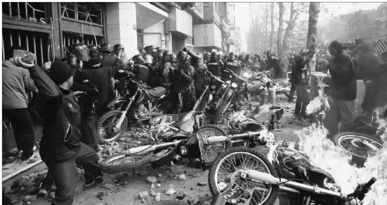
12月27日,在伊朗首都德黑兰,警察与抗议者发生冲突。

伊朗警方27日证实,在反对派支持者当天在首都德黑兰举行示威活动引发的冲突中共有5人丧生,另外有300多人被捕。