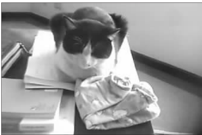
守纪律的“自习猫”

“自习猫”是南航校园里最有特权的一位。学校里所有的学生和进图书馆都要刷卡,但是这只“自习猫”却能自由进出。管理员看见它走着猫步进来,踱着猫步出去,从来干涉它的活