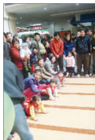
▲举办宝宝爬行大赛,是红太阳家居迈皋桥店几乎每年都会举办的活动。这样的活动,能够增强宝宝和家长们的互动,也能培养宝宝勇敢拼搏的意志。