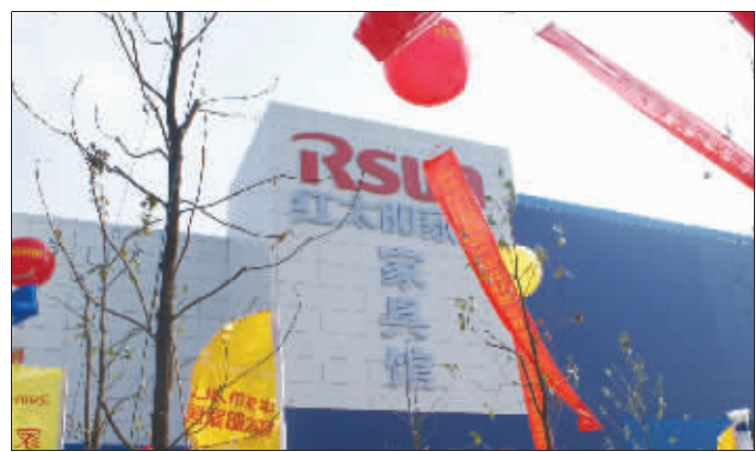
▲9月19日,南京市大桥北路48号锣鼓喧天,彩旗飞扬,一片生机盎然,备受瞩目的红太阳家居家具馆开业典礼在此隆重举行。红太阳家居馆的开业,意味着红太阳华东 MALL 所有家居板块已经全部开业。