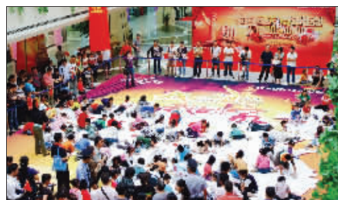
►今年是祖国60周年华诞的大庆,在国庆期间,红太阳家居迈皋桥店特地组织了百名儿童在巨幅地图上,画出他们心中的祖国。