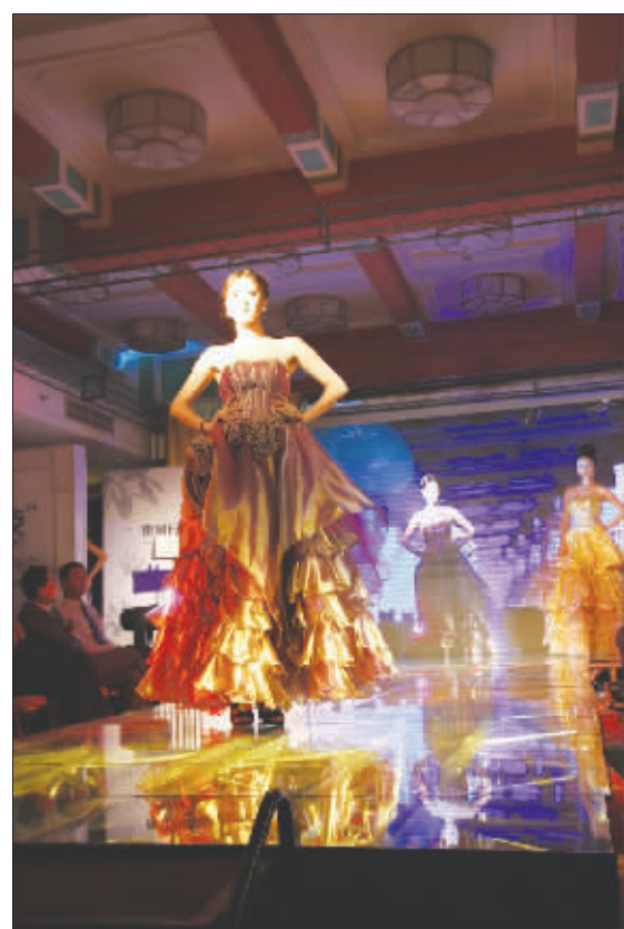
▲9月13日,东易日盛“色诱·金陵”2009秋季家装流行趋势发布会在江苏议事厅酒店盛大举行。行业主管部门、媒体代表、开发商代表、物业代表以及业主近200余人全程参与了本次盛会,见证了东易日盛时尚、华丽、激情的表演。东易日盛将家居与时尚文化相融合,图为模特儿用时装秀的方式来演绎最新家居流行趋势。