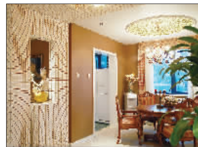
▲东易日盛连续数年在国家家装领域最高级别的美化家居设计大赛中,摘得大赛唯一一等奖。此为东易日盛设计师在2009年第十届“美化家居设计大赛”中的获奖作品。