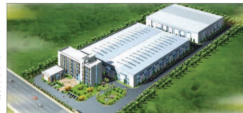
▶2010年,东方邦太占地总面积5万平方米的大规模定制样板厂房将建成投产,年产橱柜5万套,年产值突破10亿元。