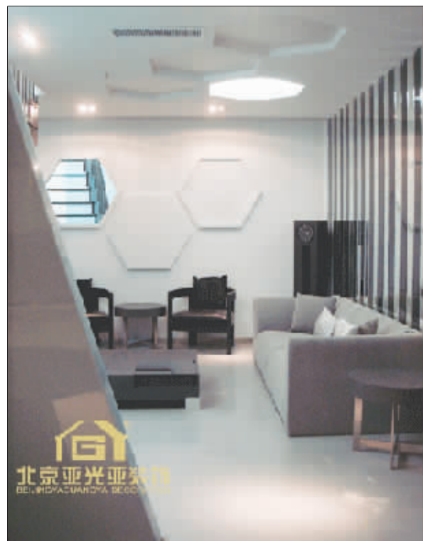
▲9月9日,亚光亚奢华家居体验馆落成,亚光亚南京公司位于龙蟠中路316号的超级旗舰店终于盛装亮相。在家装公司纷纷倡导整体家居、整体设计的今天,亚光亚奢华体验馆及模块家居馆网罗了几乎所有一线装饰材料品牌,并精心打造成欧式豪华和现代简约两个样板间,为南京市民献上了一场视觉盛宴。图为现代简约样板间一角。