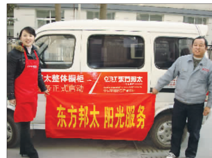
▲4年前,东方邦太启动了“阳光服务”,一年两次对东方邦太的客户上门免费回访、检修、维护、保洁,目前已经有万余名老客户享受到这项服务。