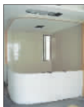
▲亚光亚装饰老史工作室一直以设计独具匠心享誉业内。这是老史工作室在金城中央的一套作品。主卧卫生间被做成半玻璃隔断形式,实用又时尚。