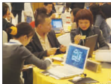
▲5月2日,由《现代快报》主办的第三届京派高品质家装品鉴会在金陵饭店隆重举办,由亚光亚装饰、东易日盛装饰、龙发装饰、业之峰装饰、元洲装饰组成的京派大腕齐聚一堂。图为亚光亚装饰的设计师为消费者解析户型。