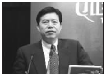
商务部副部长钟山

中国商务部副部长钟山27日在“2009中国开放经济高层论坛”上称,今年我国对外贸易,特别是出口极有可能超过德国,成为世界第一出口大国,剔除加工贸易,我国对外贸易依存度在18%左右,并不存在外界认为中国外贸依存度过高的问题。 秦菲菲 朱贤佳