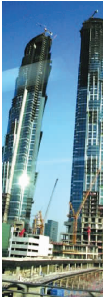
迪拜 Burj Dubai 区的停工建筑随处可见

迪拜塔的发展商是 Emaar 公司,政府持股三成。楼高818米的迪拜塔耗资80亿美元,八成物业已经卖出。2004年动工后,受金融危机影响开放日一改再改,最新说法是2010年1月4日竣工。中介告诉记者,5年前迪拜塔还没开建时,每平方米已达5.6万元人民币,2008年时暴炒到20万元人民币/平方米,眼下已降到7万元人民币/平方米,等于高位时的三折。