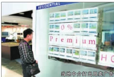
当地中介打出甩卖广告

过去5年,迪拜上马了3000亿美元的工程项目,房地产一下跻身迪拜第三大支柱产业。奢华、高供应、高回报、设计天马行空是迪拜房地产的关键词。今年再加上一个:暴跌。截至三季度,现楼同比缩水超过45%,楼花暴跌57%,新房空置率超过四成。 据《广州日报》