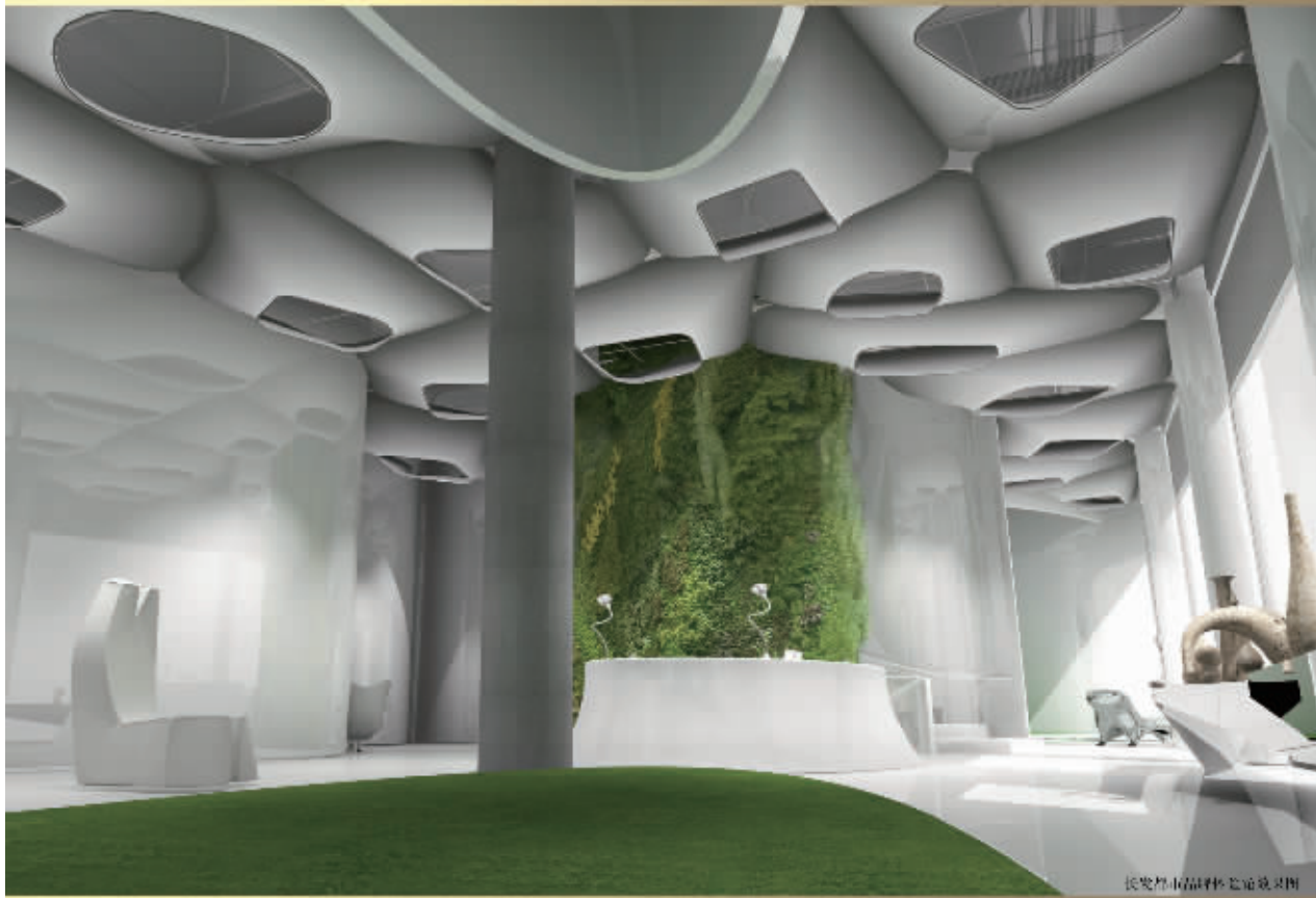
长发都市品牌体验馆效果图