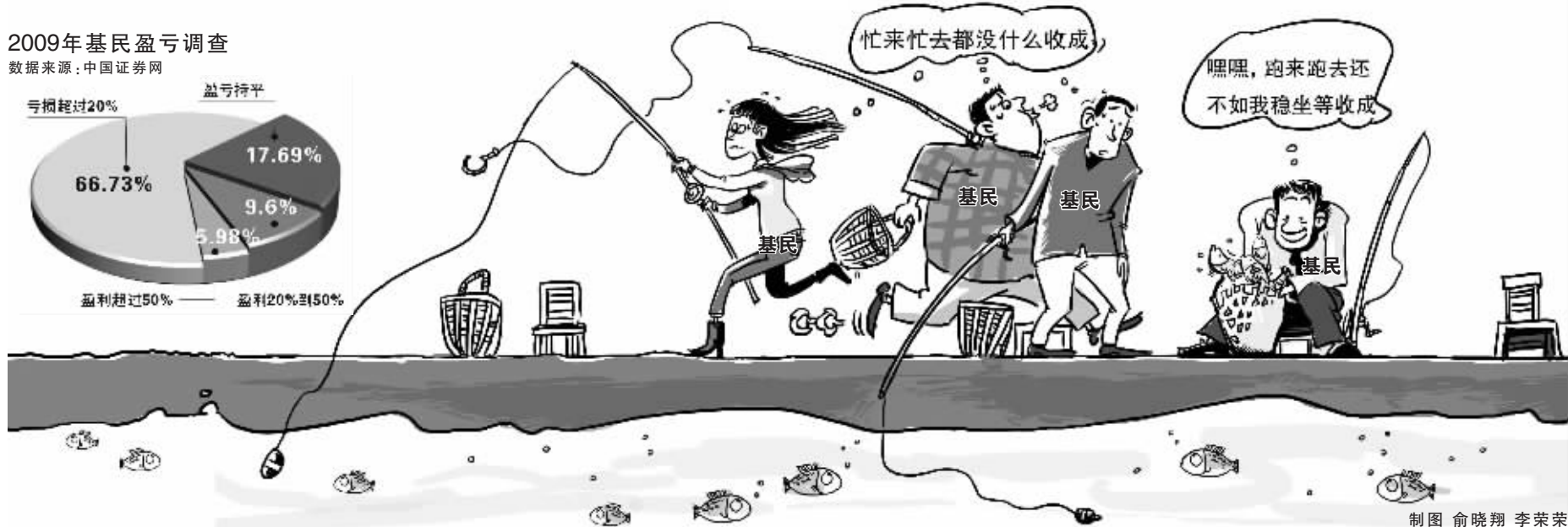
制图 俞晓翔 李荣荣