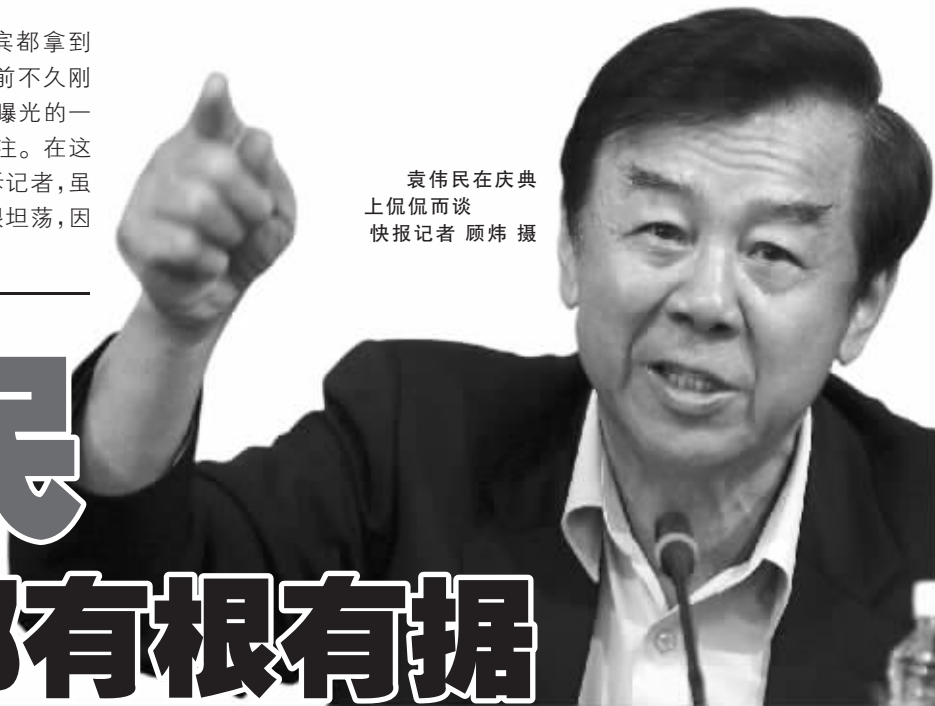
袁伟民在庆典上侃侃而谈