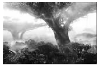
3D的奇幻场景让人叹为观止

漂浮的仙山在中国神话中常见,像《蜀山》《风云》等电影都有表现,但是请相信跟《阿凡达》中的场景相比完全不在一个数量级。