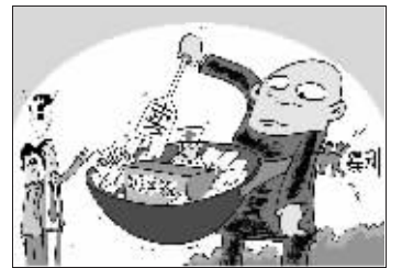
《炒卖专家号》 刘道伟 绘