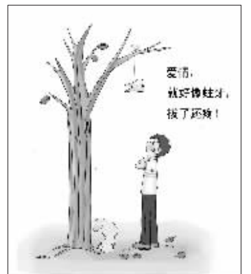
《爱情与拔牙》 刷刷 绘