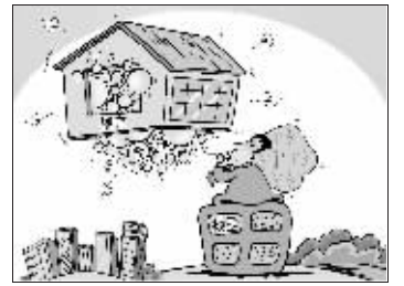
《吹泡泡》 刘道伟 绘