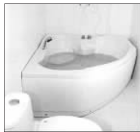
高级住宅内部装修