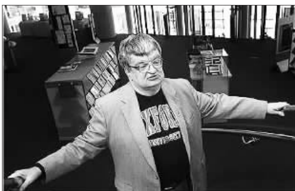
现实版“雨人”吉姆·皮克,12月19日因病去世

不过,随着与人群接触的机会增加,皮克在社交能力上有了长足的改进,建立更多的自信。到后来,他“说好话”的几率已多出言不逊的机会,甚至懂得赞美别人。