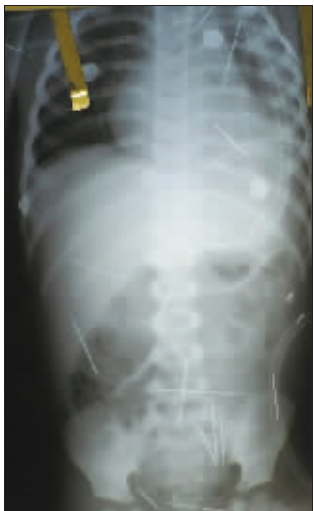
男童体内的缝衣针让人触目惊心

日前,巴西东北部巴伊亚州的巴雷拉斯医院接诊了一名年仅2岁的小男孩,他自称浑身不适。经X光片检查,医生惊讶地发现男童体内竟有50根缝衣针。医生怀疑,这些针可能是有人恶意扎进男孩体内。目前警方经过初步调查,已经确定男孩的前继父和另外两名妇女是本案嫌疑人。