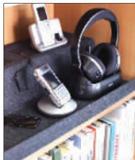
到宜家逛一逛,能淘到很多这样适用于蜗居的家具