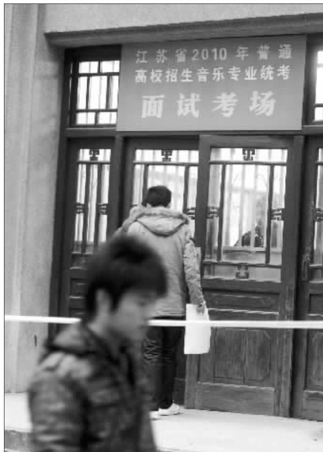
考声乐,考生步伐较轻