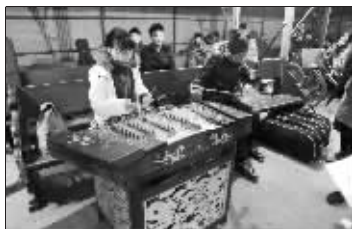
器乐考生考前都不放弃练习