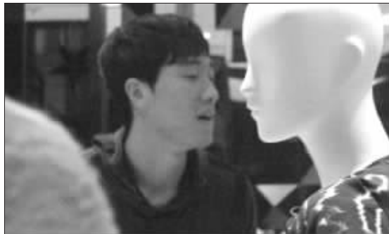
刘翔在香港过了把购物瘾