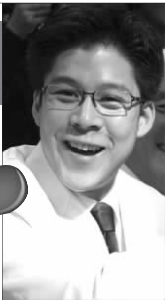
霍启刚大方观战,表达爱意