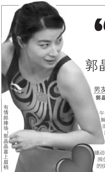
有情郎捧场,郭晶晶喜上眉梢