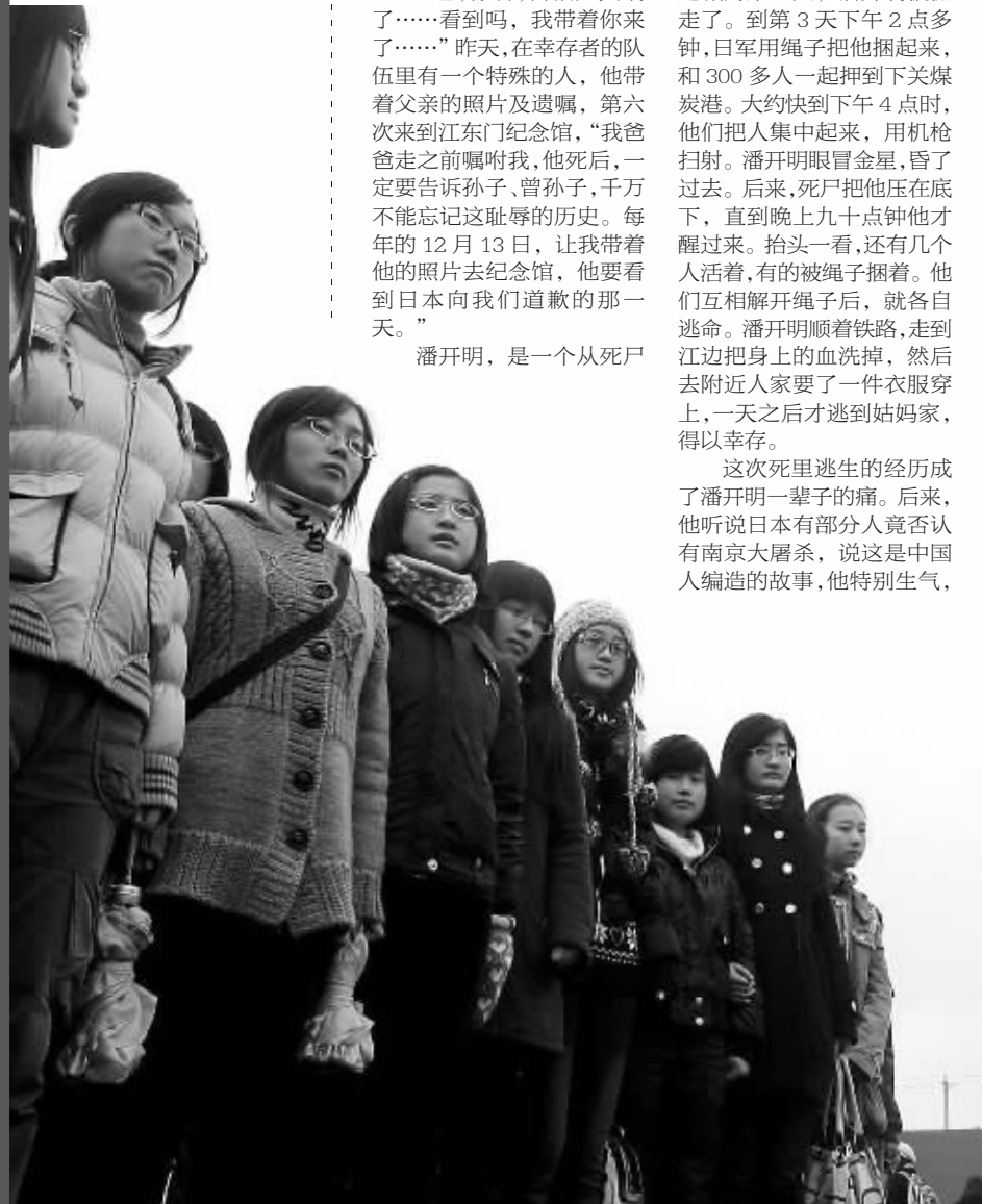
广场上, 群众悼念同胞

昨天上午10点, 刺耳的警报在南京上空拉响, 声声凄厉。侵华日军南京大屠杀遇难同胞纪念馆内, 5000多人参加了侵华日军南京大屠杀30万同胞遇难72周年仪式, 阴冷的冬日里泪流无声。随着和平的钟声敲响, 数千白鸽振翅飞向蓝天……12月13日, 这是中国人心中永远的痛, 72年前的这天, 南京沦陷, 这一天开启了一个永载人类历史的灾难, 30万同胞陆续惨遭屠杀。