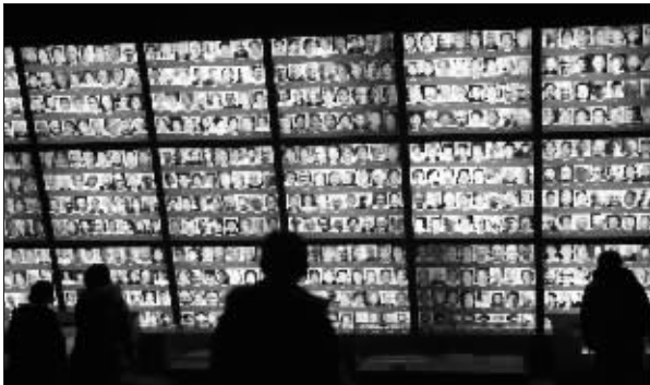
观众在观看南京大屠杀幸存者的照片