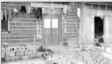
◀周家看起来境况不佳