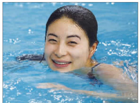
嘻嘻,打死我也不说

昨天,一群记者眼睁睁地看着郭晶晶抵达香港而无可奈何,什么都采访不到,这就是“娱乐明星”郭晶晶给香港记者的当头一棒!东亚运动会明日就将落幕,“香港准媳妇”的到来无疑将再掀高潮。不过在机场,她笑而不答,在酒店,她甚至直接从秘密通道到达房间,连身经百战的香港娱记都自叹不如:“看来郭晶晶真是越来越‘狡猾’了!”