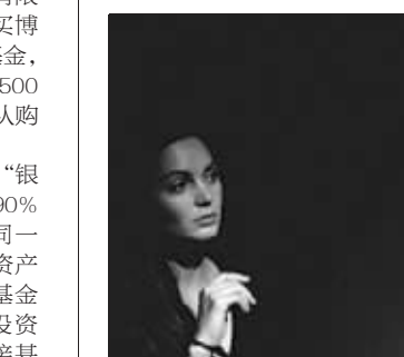
添力加油站工作人员

截至前晚9点,国际油价标杆纽约商品交易所明年1月交货的原原油期货价格在72美元上下徘徊,最低一