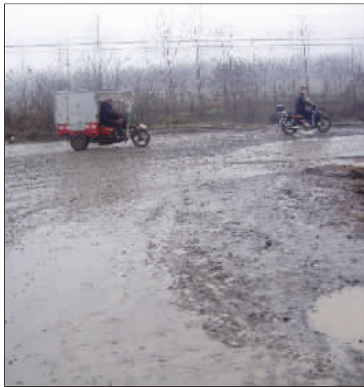
事发路口,道路十分泥泞

昨天早晨七点钟左右,六合区八百桥镇塔山村发生一起惨剧:一对夫妻在骑摩托车送女儿上幼儿园途中遭遇车祸,摩托车被一辆从后面超车的大货车刮倒,年仅30岁的妻子当场被撞身亡。据当地村民介绍,她是用自己的最后力气把女儿抛了出去,才使得女儿幸免于难——