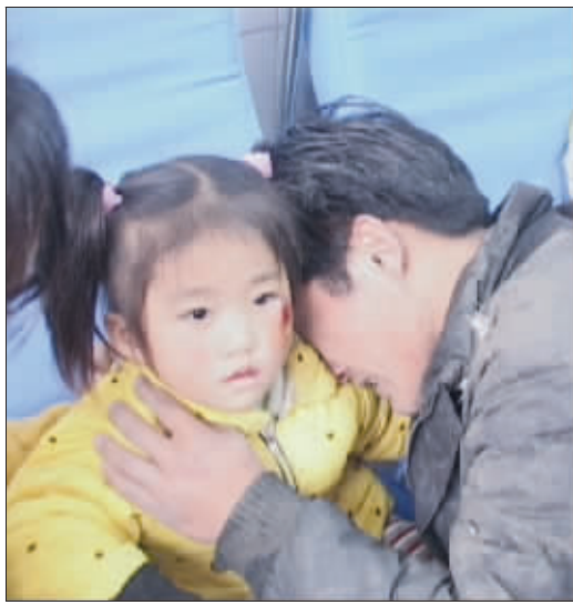
逃过一劫的父亲抱着幼女大哭