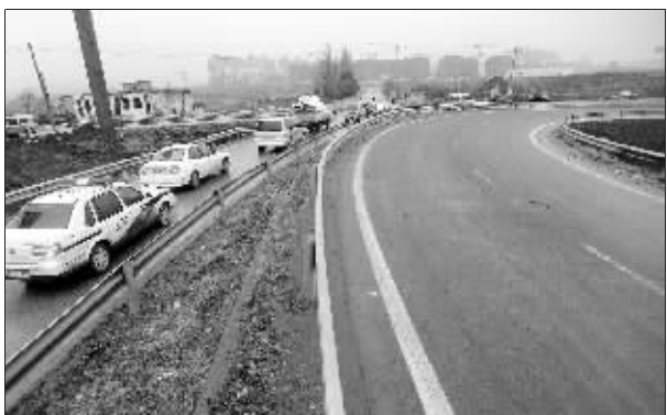
匝道(右)封闭,便道(左)难担重任

交管部门说,为方便市民通行,他们已要求施工单位重铺便道,并在早晚高峰拥堵路段打开匝道放行。