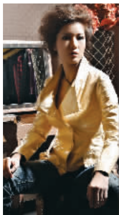
LUXMAN 外套 5980元

冲淡了皮装干练的一面。若你让自己变得更为成熟高贵,可以选择柔软如雪纺等材质的衬衫或长裙款来作为内里搭配,或是搭上荷叶边、蓬蓬裙等细节的裙款,带来甜美熟女的气质。当然,在色彩方面,也不必都选择保守的黑色,亮黄、桃红都是可以纳入衣柜的。让你呈现出一派摩登的都会女郎形象。