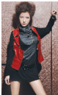
ARWEN DEFEE 长裙 3300元 马甲 2480元 皮带 730元 挂件 460元

造型:崔文丽(尚金造型) 模特:文文 服装提供:东方商城