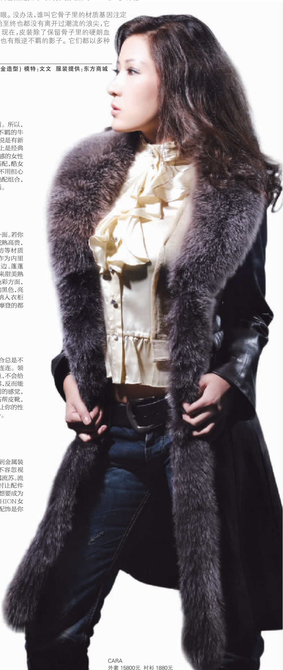
CARA 外套 15800元 衬衫 1880元