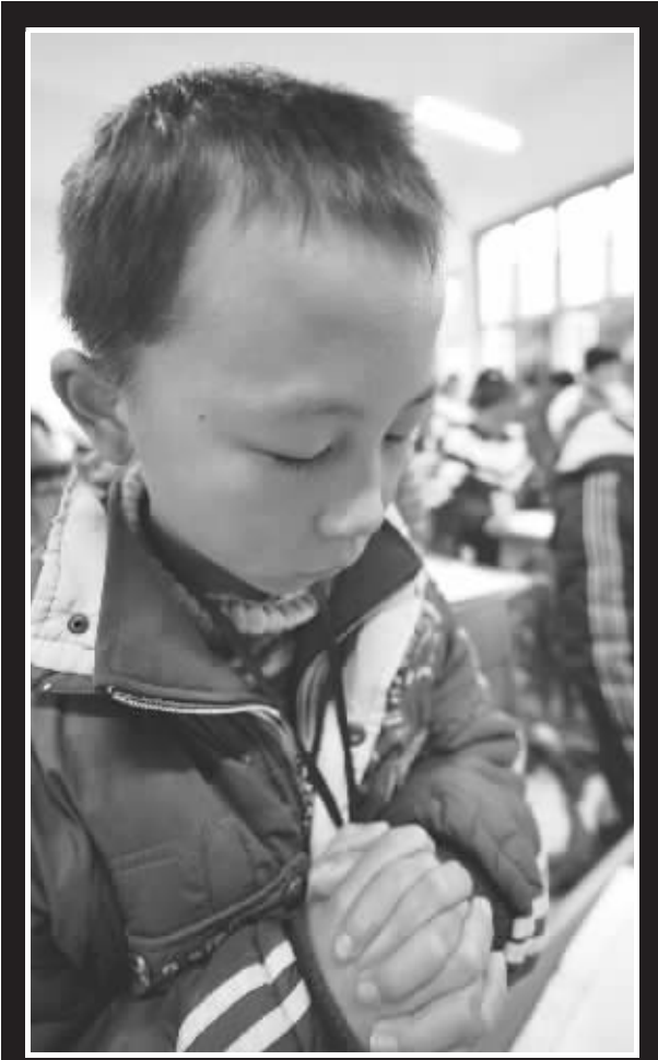
昨天,一名学生在上课前为死难同学默哀。

“那个同学刚开始还大声呼喊‘救命’,后来就听不到声音了。”在湖南湘乡育才中学重大踩踏事故中死里逃生的小杰(化名)回忆说,“当时特别痛,根本没法动弹,更可怕的是,我呼吸困难,只能张大嘴巴,通过左边一个空隙透过来一丝凉风维持呼吸。”小杰是育才中学14岁初三学生,在病床上回忆那惊魂一刻仍心有余悸——