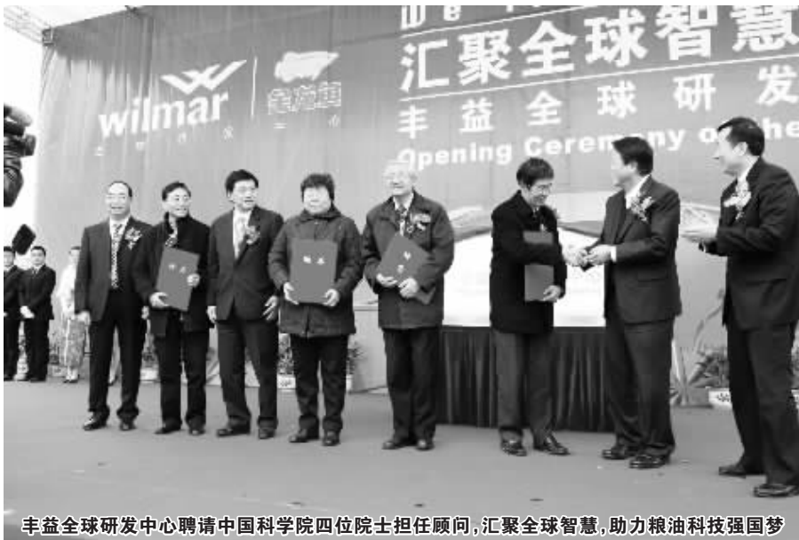
丰益全球研发中心聘请中国科学院四位院士担任顾问,汇聚全球智慧,助力粮油科技强国梦