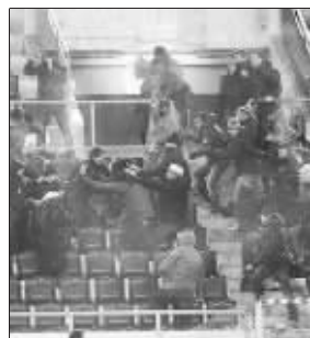
昨晨,意甲联赛,罗马1:0力克拉齐奥。场上球员拼抢,场下球迷也在大打出手。

●上周末的一场意乙联赛,阿斯科利主场对阵雷吉纳,雷吉纳打进第一球时,阿斯科利11名球员居然全部站着不动,看着对手将球打进!原来阿斯科利打进的第一球是趁着对方球员受伤时偷袭成功的。