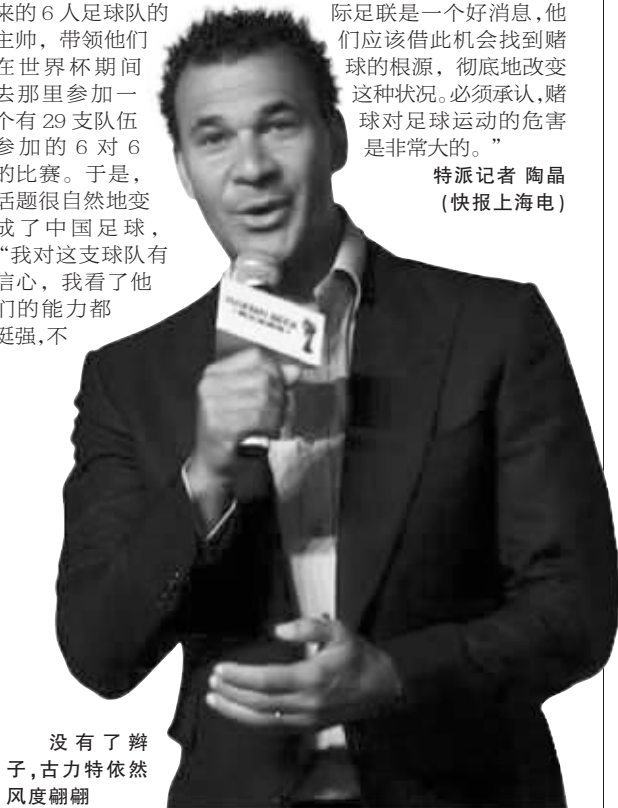
没有了辫子,古力特依然风度翩翩