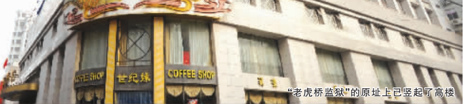
“老虎桥监狱”的原址上已建起高楼

不过,1927年的统计资料显示,这一年,江苏第一监狱的748名犯人当中,居然出现了595名公务员。究其原因,这一年,蒋介石刚制定都南京,政权更迭的复杂性,奇特地在罪犯比例上得到了体现。