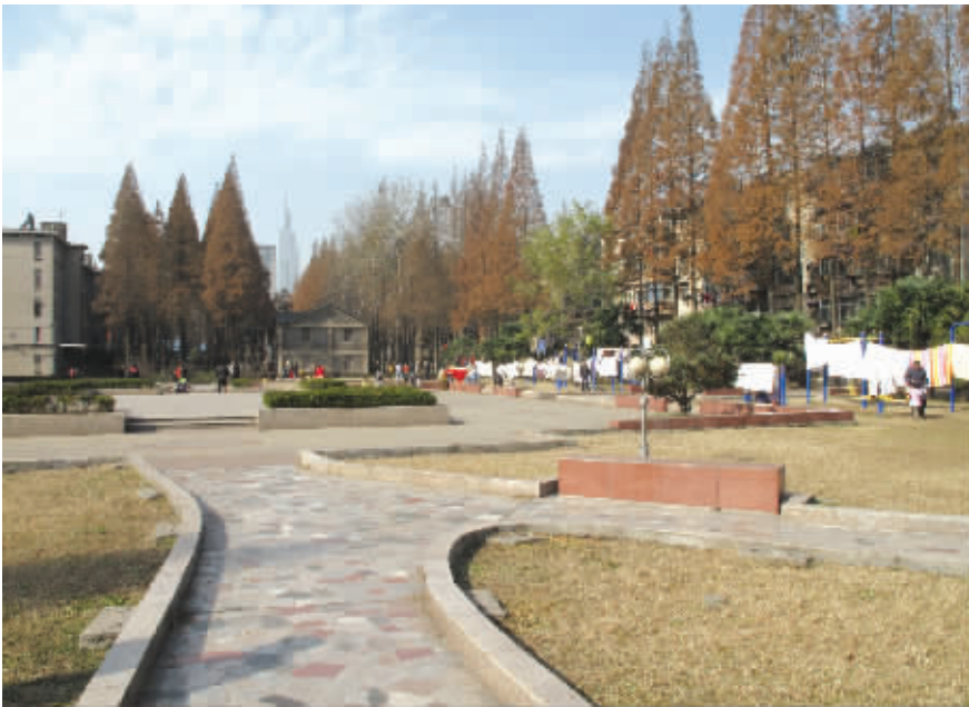
当年小营监狱的位置如今充满了生活气息

就在丁默■被执行枪决之后两年,1949年6月,南京首都监狱改称南京市人民法院监狱。后来,这里又先后被改称南京市监狱、江苏省第一监狱。1999年,江苏省第一监狱整体搬迁到铁心桥。至此,老虎桥近百年老监狱的历史画上句号。