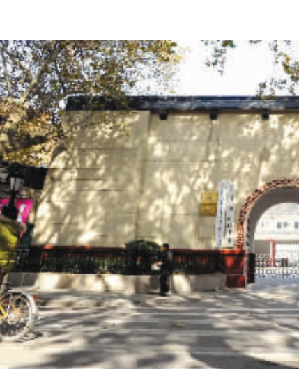
这里曾是日伪南京监狱的大门,如今已鲜为人知

南监是一座高大的人字脊平房,南北走向,从外面看,东西两侧离地约三米的墙上,各开有一排透气窗。大门朝南,走进进去是一条狭长逼仄的走廊,走廊两旁各有面积相同的12间监房。监房的门朝着走廊,门对门的墙上,就是刚刚从外面看到的那两扇透气窗,窗框的边长半米不到,上面锁着铁栅栏。监房的地板比外面的走廊高