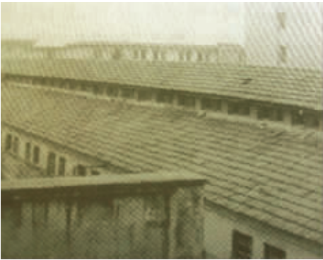
当年中央军人监狱的监舍,60多年后外形无太大的改变

迁至安徽、湖北、长沙、芦溪等地。1940年8月,监狱解体,一部分留在湖南组成湖南第二监狱;另一部分去了重庆监狱,也就是通常所说的中美合作所。也就是说,中美合作所内的渣滓洞、白公馆等监狱,其前身正是中央军人监狱。