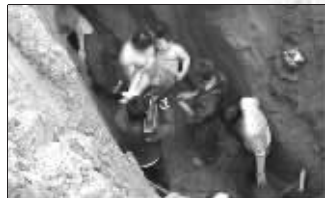
战士们从坑中抱出孩子