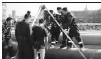
倒悬救人未获成功