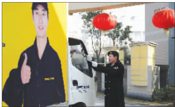
物业调查关注的都为热点话题,从而得到了各方面的重视

业主的积极参与,更印证了本次物业调查迎合民意。统计数据显示,问卷征集首日,就有两百多位业主参与问卷填写,当周问卷填写总数超过500份。截止到调查系统关闭,调查小组共接收到网络问卷864份,信件邮递问卷480