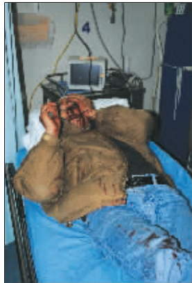
司机被打得浑身是血

“用铁棍对人狂打,哪有这样的保安啊?就像土匪似的。”据知情者向笔者透露,被打的男子是司机,前来电梯公