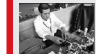
然后把印有获奖者姓名的金色方片贴在凹陷处