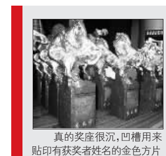
真的奖座很沉,凹槽用来贴印有获奖者姓名的金色方片

不过,根据24项提名的名单来看,获得提名的团队或者个人的总数量达到了87个,所以“金名片”至少也要印出87张。而为了防止因为“双黄蛋”而出现奖座不够的情况,组委会还特别多准备了几匹“马”,记者数了一下,摆在手工师傅面前的“马群”,一共有27只。莫非,金马奖真有向金鸡看齐甚至超越之势——最多可以下3个“双黄蛋”? 信息时报