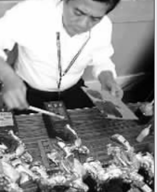
手工师傅将胶水倒在木板上,涂抹在奖座的凹陷处