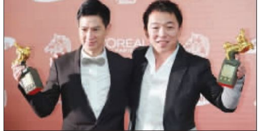
同时得金马影帝的张家辉和黄渤

今年金马奖将影帝颁给港星张家辉和大陆演员黄渤,创下金马奖46年来首度“双影帝”。评审团主席虞戡平说,支持两位演员的评审僵持不下,最后只得双双影帝解决这个难题。