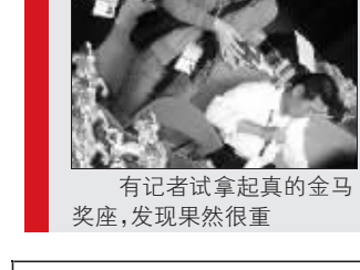
有记者试拿起真的金马奖座,发现果然很重