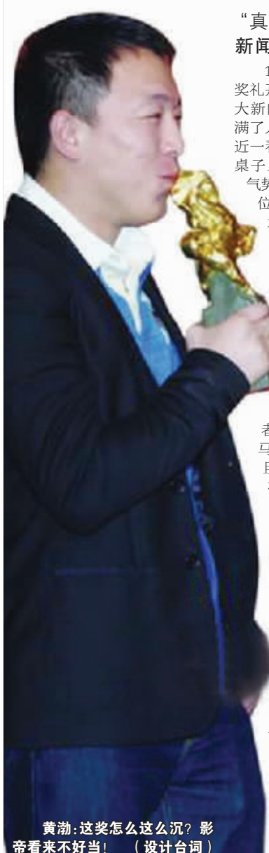
黄渤:这奖怎么这么沉?影帝看来不好当! (设计台词)