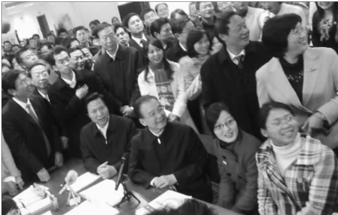
温总理与大学生们亲切交谈,现场气氛热烈。有同学“抢”提问机会,吸引了大家的目光。

“温总理来了!”昨天下午,南京工业大学图书馆成为全校的焦点。到南京参加第十二次中欧领导人峰会的国务院总理温家宝在省领导梁保华、罗志军等陪同下来到南工大丁家桥校区,考察了该校材料化学工程国家重点实验室,并且到图书馆看望了大学生们。温总理的亲切、睿智、幽默与博学,令全场不时发出阵阵掌声与欢笑。