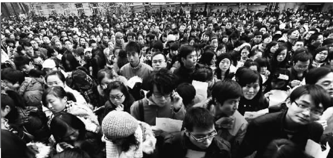
▶在南京林业大学考点,黑压压的“考碗”大军准备进场