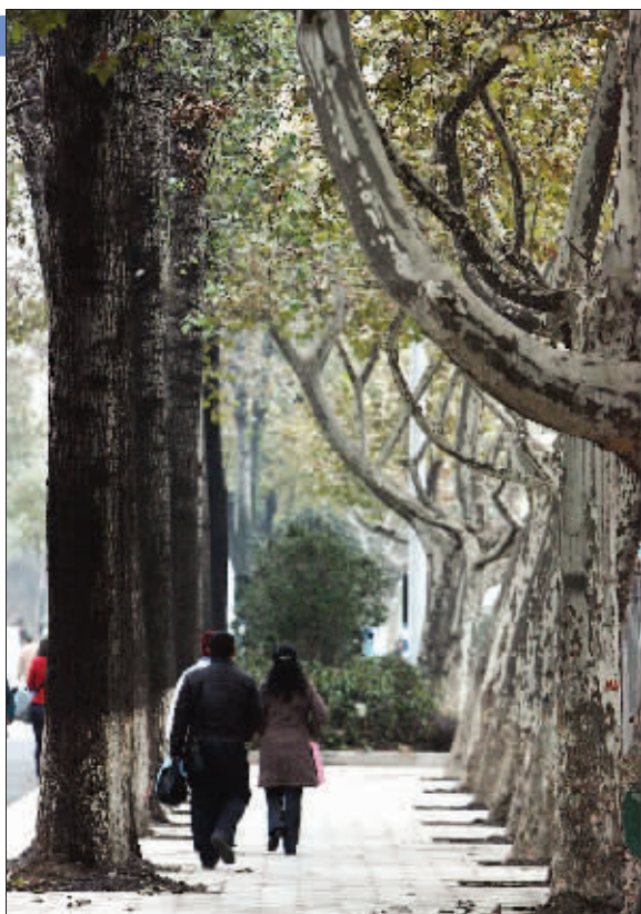
中央路新打造的“林阴大道”

记者在现场看到,路中央较低的花箱内种上了黄色的三色堇和橘黄的金盏菊,较高的花箱内种上了紫色的三色堇。据市园林局道路绿化整治领导小组办公室副主任乌明介绍,移动花箱一年会换八次装,冬天换一次面孔能维持30~40