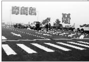
243省道通车,平交道口设置了人行横道