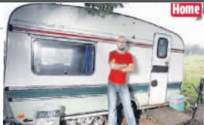
马克生活的大篷车