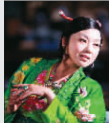
闫妮 参考道具:绿色服装、首饰