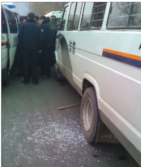
男子被送上警车拉走

“你先把碎片放下,有什么事可以谈。”一名便衣女子隔着铁栏杆和男子对话。男子情绪激动,玻璃片在两手间交换,嘴里嚷着:“不活了,不活了!”