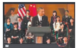
坐在奥巴马斜后方

对于颇受关注的红外套,博客中则解释说,“由于需要穿正装以示尊重。害怕突显自我我选择了简约的黑色衬衫”,“那天上海还下着雨,早晨只有几度,我穿件外套应该也在情理之中吧。我们是先进入会场等候,进入会场我就把外套脱了,当时奥巴马并没有出现。”“谜已揭开,