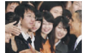
与奥巴马大方握手